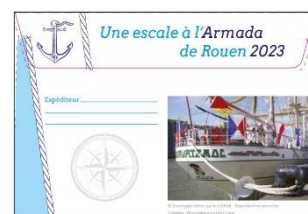
Carte postale n°1